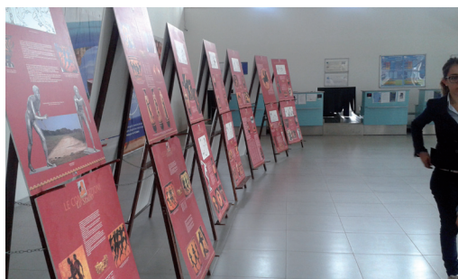
Aeroporto S. Anna