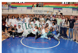
Scuola Campione provinciale 1° e 2°