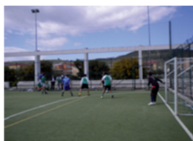
Calcio a 5